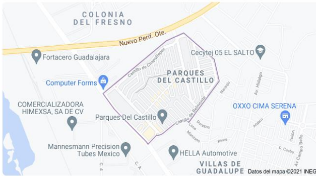
Parques del Castillo San José del Castillo, Jal.