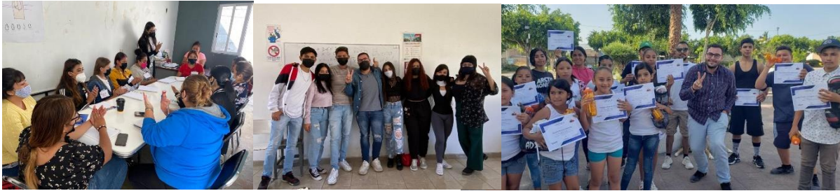
Curso de Aplicación de uñas Cursos de Preparación Examen de Admisión UDG Curso de Box