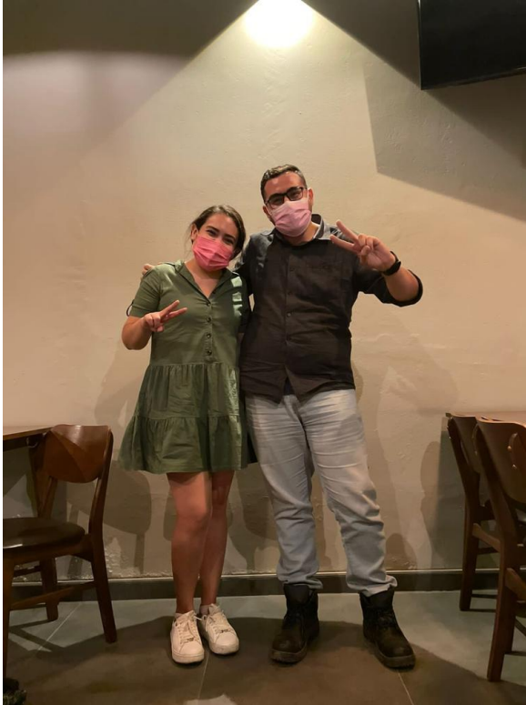
JUVENTUDES DEL ESTADO